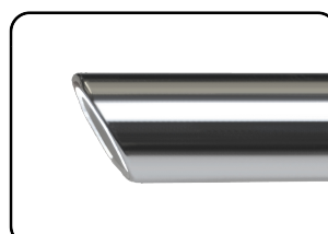
Blickwinkel Direction of view 30°

Endodoctor GmbH tale-off Gewerbepark 2 D-78579 Neuhausen ob Eck Telefon: +49-(0) 7467 - 94 51 89 0 eMail: kontakt@endodoctor.de