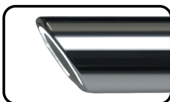
Blickwinkel Direction of view 30°